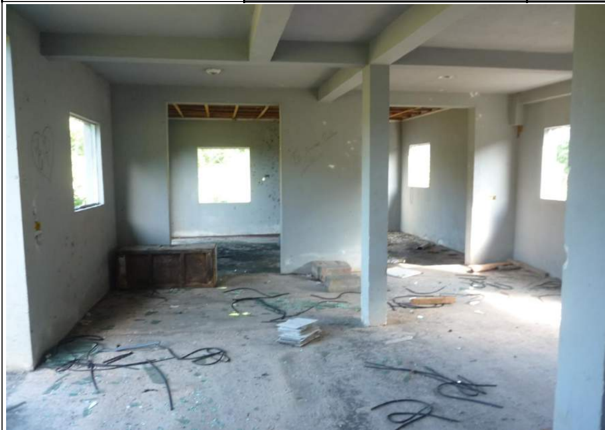
FOTO 10= VISTA INTERNA DA EDIFICAÇÃO, COM DEPREDÇÃO E ROUBO DE ESQUADRIAS DE ALUMÍNIO