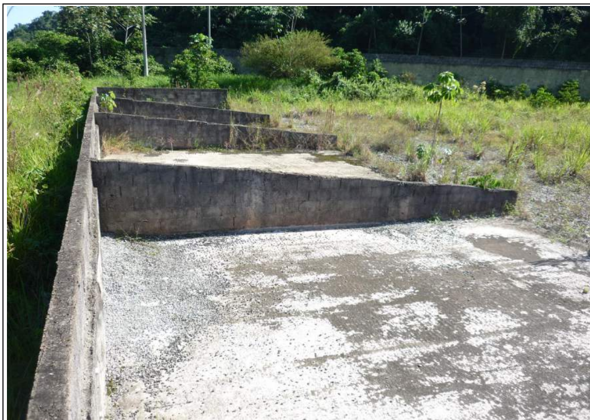
FOTO 09= BAIAS DE CONCRETO ARMADO PARA ESTOCAGEM DAS MATERIA PRIMA PARA CONCRETO USINADOS