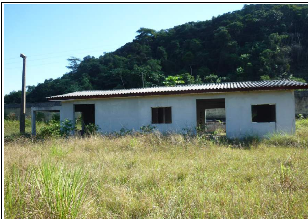
FOTO 11= VISTA DA FACHADA DA CONSTRUÇÃO EXISTENTE, NO ESTADO DE ABANDONO