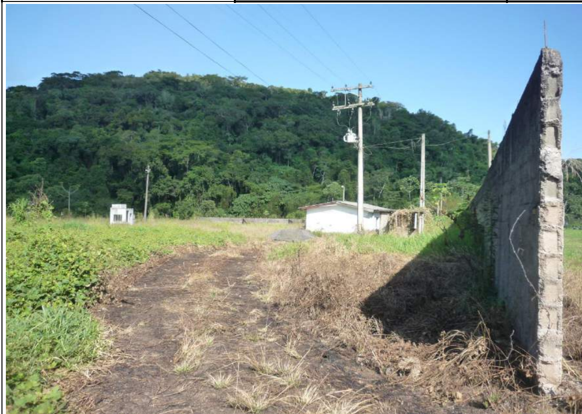
FOTO 05= VISTA GERAL DA ÁREA PELO PORTÃO DE ACESSO PELA ESTRADA EXISTENTE