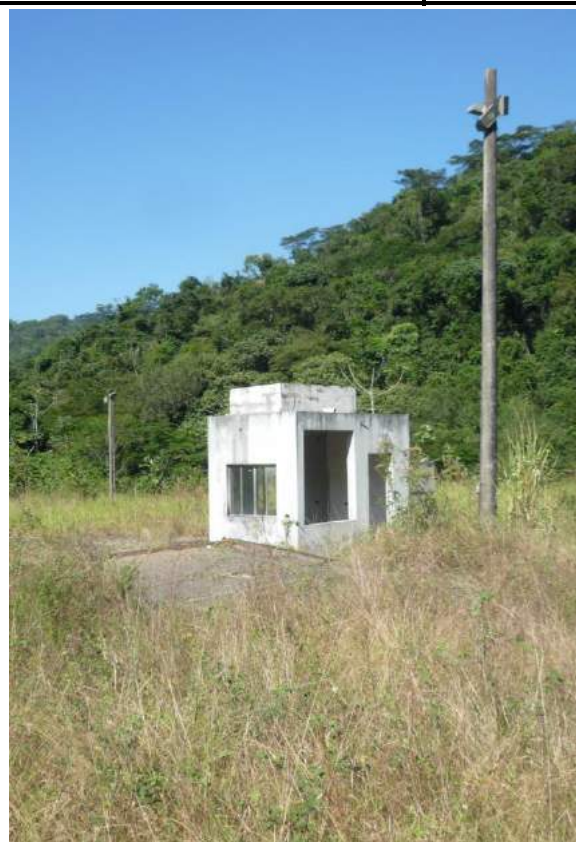
FOTO 07 e 08 = FOTOS DAS INFRAESTRUTURA DE ENERGIA , MAS SEM USO, EXISTENTE NO IMÓVEL